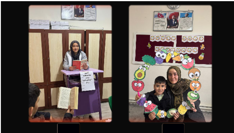
- Kitap Değerlendirmeleri -Miniklerin Etkinlikleri