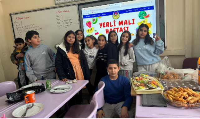
Yerli Malı Haftası