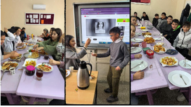
Hep Beraber Kahvaltı